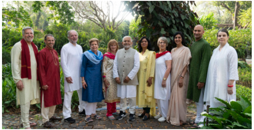
PRASAD Project, PRASAD Chikitsa, PRASAD Australie, PRASAD France & PRASAD Espagne

La réunion internationale de PRASAD a été particulièrement opportune et inspirante cette année. Notre groupe s'est rendu en Inde avant la pandémie de COVID-19, nous avons donc eu la chance de pouvoir encore rencontrer et parler avec les gens en face à face. Nous avons visité les programmes en cours dans la vallée de la Tansa, rencontré les bénéficiaires et les équipes et pris connaissance des résultats préliminaires d'une évaluation des besoins récemment effectuée.